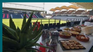
ACCÈS MATMUT STADIUM

Métro B – arrêt : Stade de Gerland. Parking gratuit de 700 places privatisables.